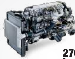
270PS Common Rail